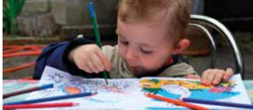
Nieuwe kleuterlokalen in aantocht p.2