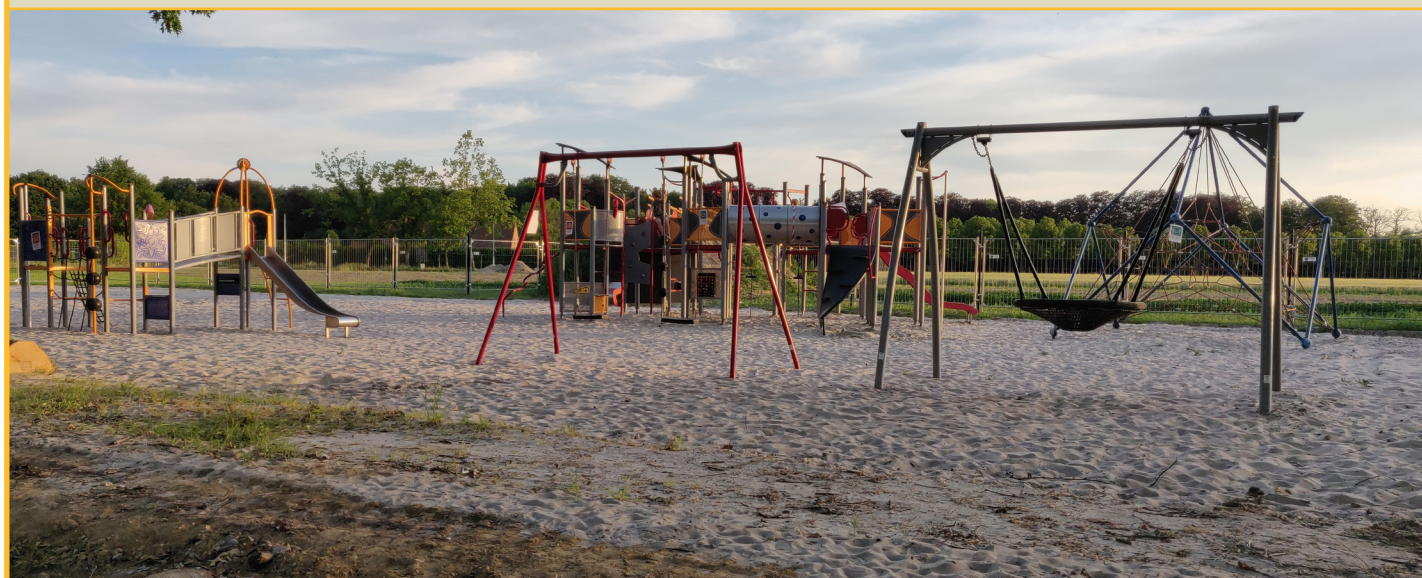
De huidige speeltuin op het sportcentrum wordt deze zomer vervangen door een natuurspeeltuin.