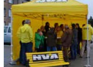
De N-VA-babbelbank komt naar u toe p. 3