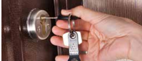
Minder woninginbraken in Aartselaar p. 2